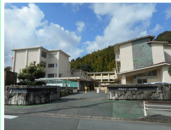
浜松市立二俣小学校