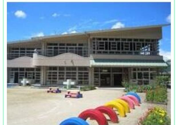
浜松市立二俣幼稚園

※この図面はATBBの物件情報の一部を抜粋して掲載しております。(現況優先) ※入居日・引渡日変更や付帯条件、別途料金が発生する場合がありますのでご確認ください。